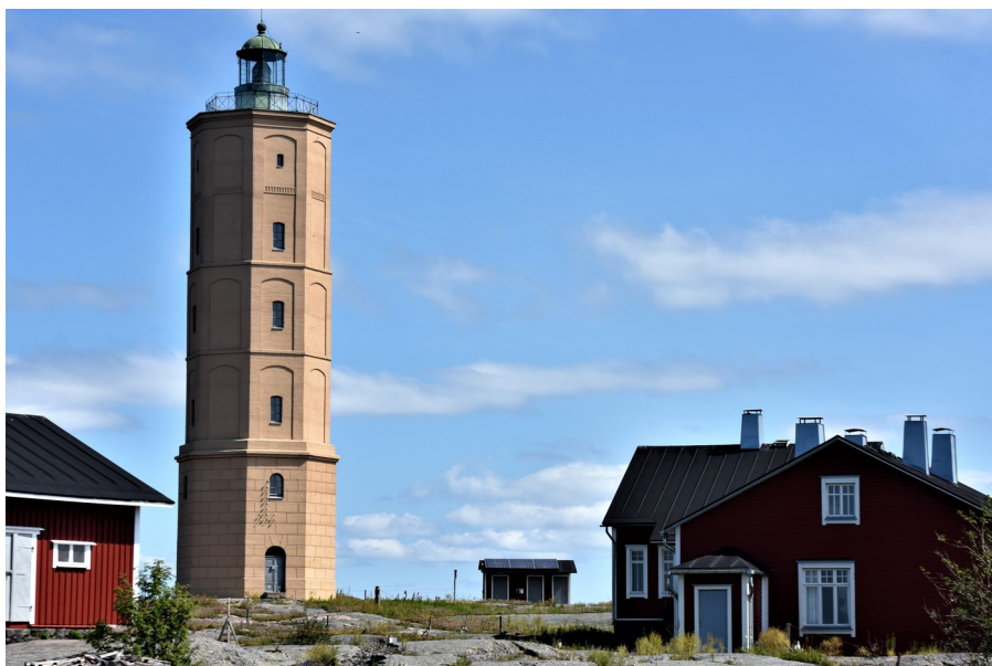
Kunnostettu majakka. Teatteriretki Lahteen la 28.3.